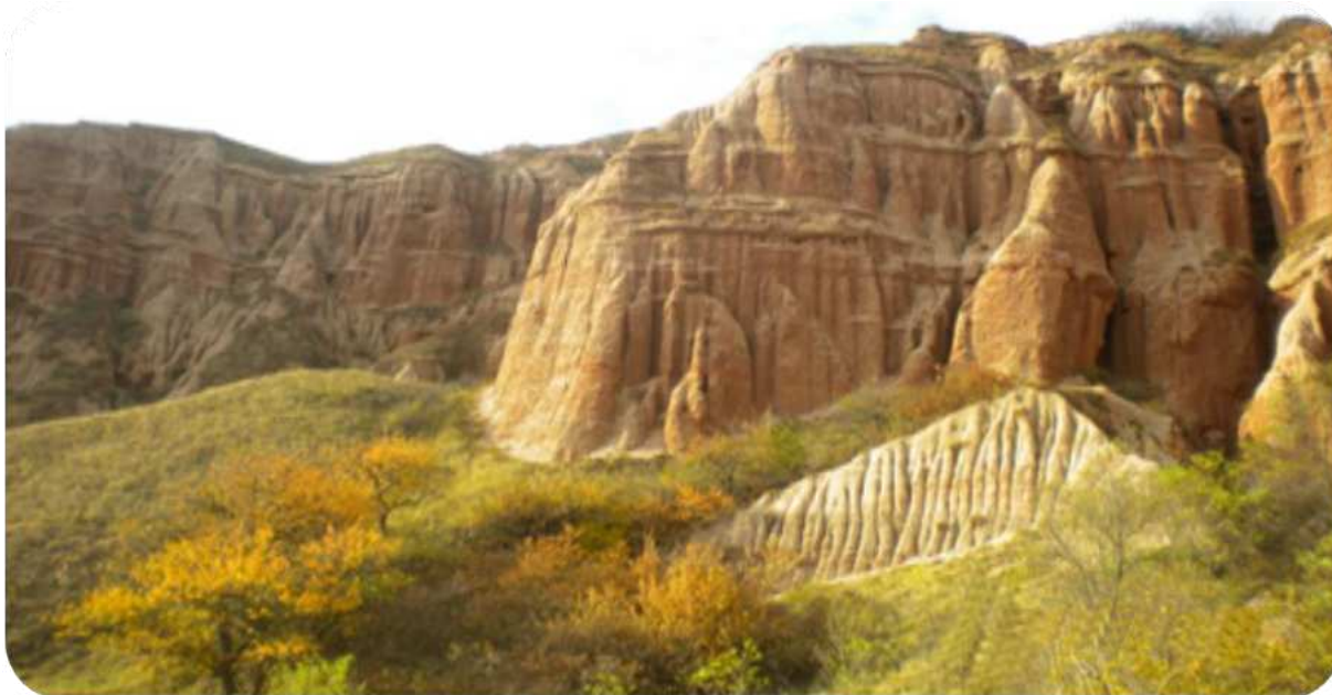
Râpa Roșie -Sebeș

Timpul necesar pentru sedimentarea și săparea văilor este evaluat de către geologi la circa 60 milioane de ani. Abruptul spectaculos al reliefului de la Râpa Roșie, și-a dobândit reputația de monument natural datorită aspectului geomorfologic atât de particular al gresiilor cuarțo-argiloase, cu intercalații de argile roșii, care sunt supuse și azi unor active procese modelatoare.